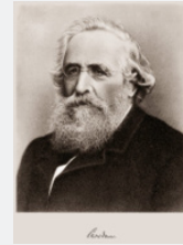
Conrad Widmer gründet den ersten Schweizer Lebensversicherer.