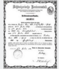
Die erste BU-Police